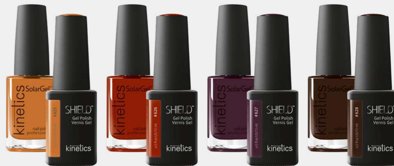
GET COZY GET COZY SNUG SNUG REVEAL REVEAL ESPRESSO ESPRESSO #KNP625 #KGP625N #KNP626 #KGP626N #KNP627 #KGP627N #KNP628 #KGP628N SOLARGEL POLISH SHIELD GEL POLISH SOLARGEL POLISH SHIELD GEL POLISH SOLARGEL POLISH SHIELD GEL POLISH SOLARGEL POLISH SHIELD GEL POLISH