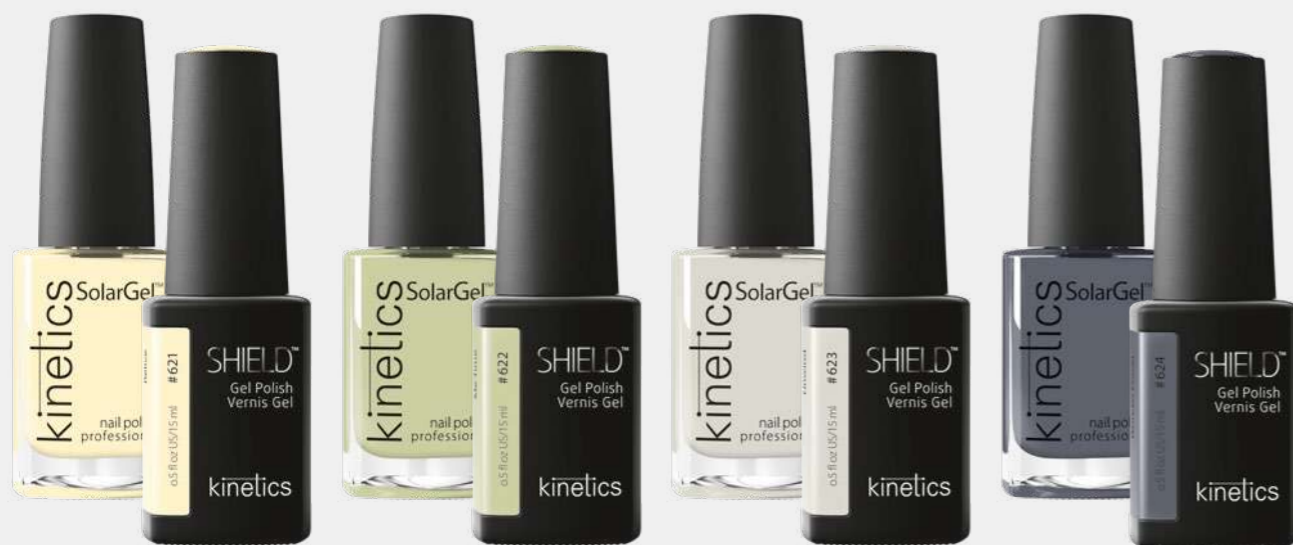
RELIVE RELIVE ME TIME ME TIME UNWIND UNWIND WONDER POWER WONDER POWER #KNP621 #KGP621N #KNP622 #KGP622N #KNP623 #KGP623N #KNP624 #KGP624N SOLARGEL POLISH SHIELD GEL POLISH SOLARGEL POLISH SHIELD GEL POLISH SOLARGEL POLISH SHIELD GEL POLISH SOLARGEL POLISH SHIELD GEL POLISH

TUTTI I COLORI SONO DISPONIBILI IN SOLARGEL E SHIELD GEL POLISH