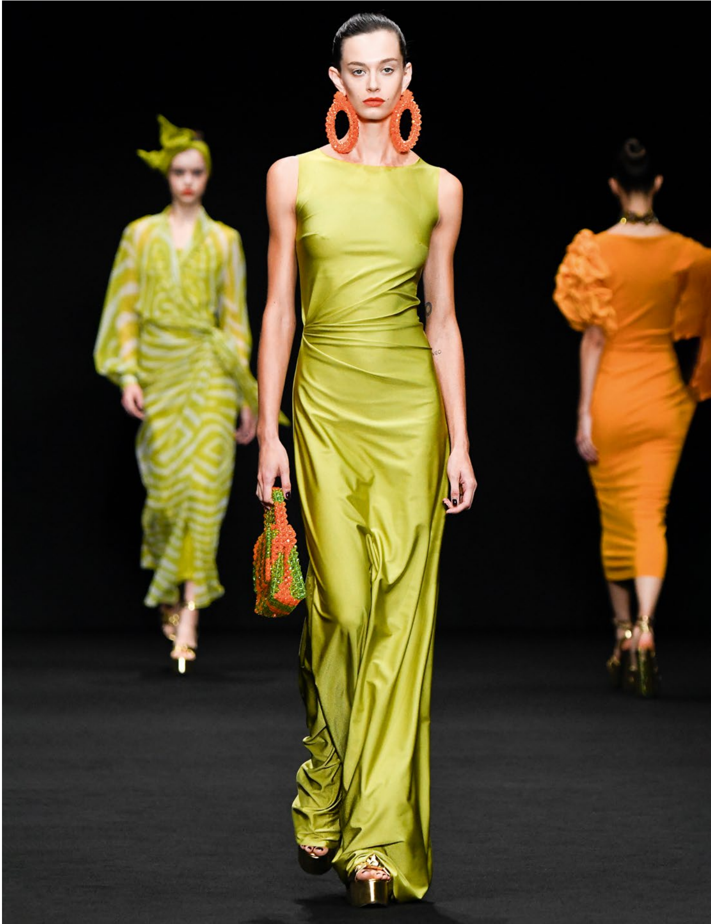
Chiara Boni La Petite Robe